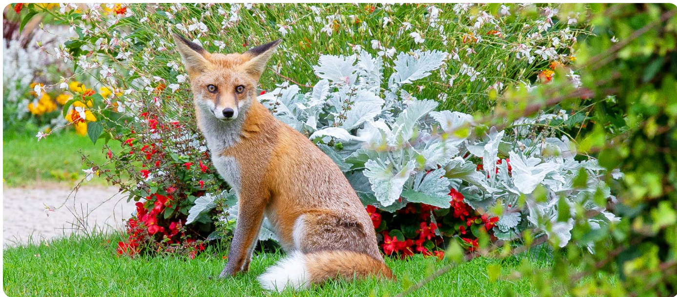
Ein Fuchs in einem Berliner Park

3 Füchse sehen Hunden ähnlich , können aber klettern wie